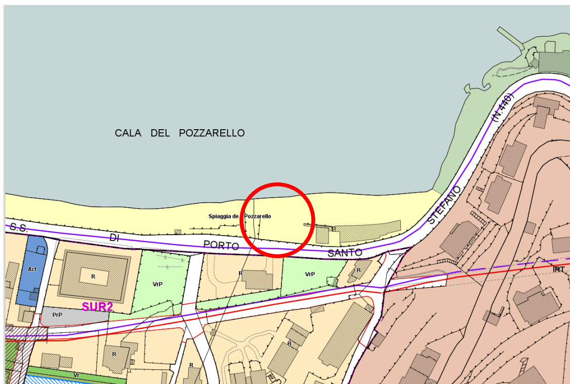
Regolamento Urbanistico - AMBITI TERRITORIALI, URBANI E AREE DI INTERVENTO