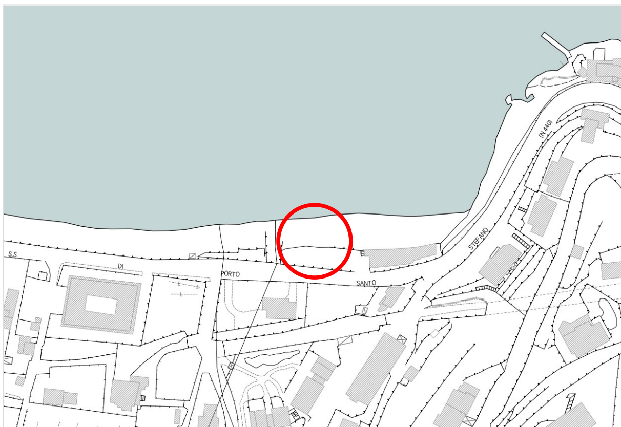
Estratto Carta Tecnica Regionale