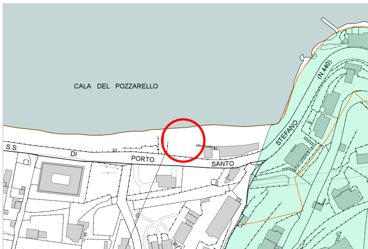
Estratto Tav. B.3.2.1 Vincoli ex lege

Fascia di rispetto stradale (D.L. n°285 del 30 aprile 1992 e D.P.R. n°495 del 16 dicembre 1992)